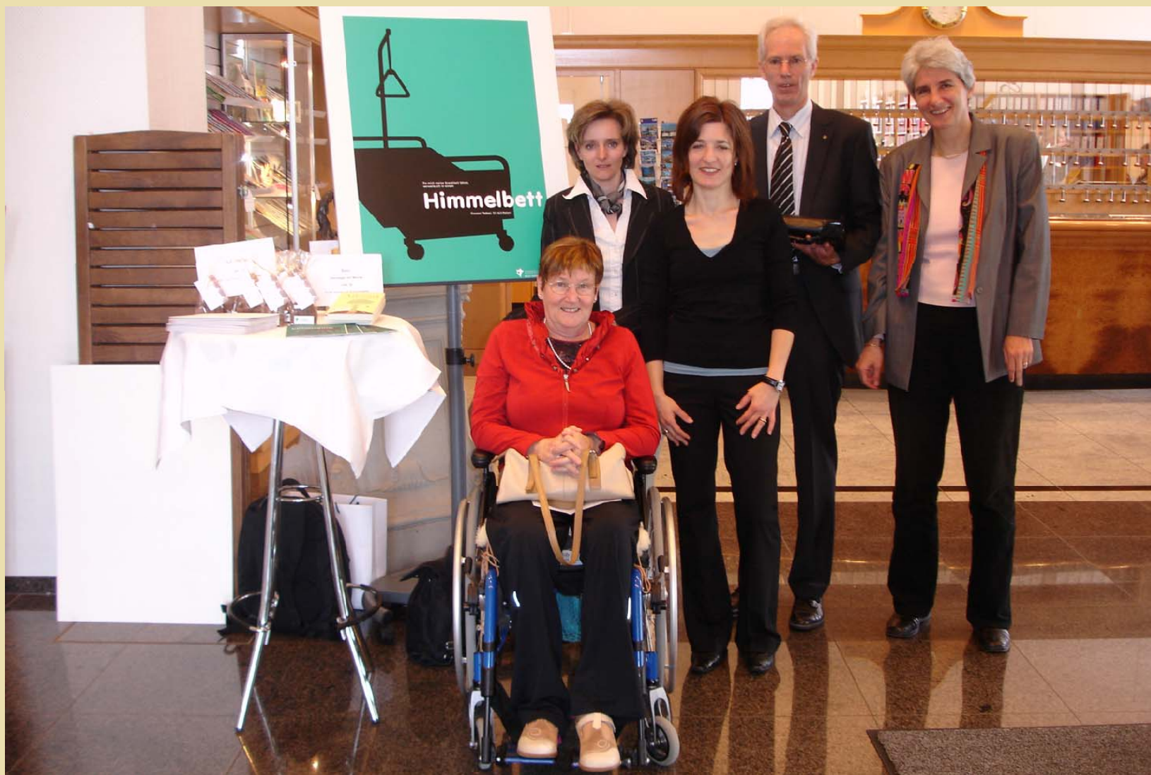
Distriktskonferenz 2008 in Brunnen